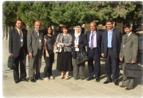
المشاركين في المؤتمر الثاني للرسائل الجامعية الاردن