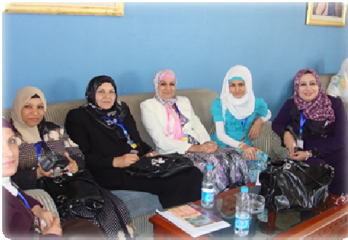
المؤتمر الثاني عشر لتغذية الحيوان / مصر